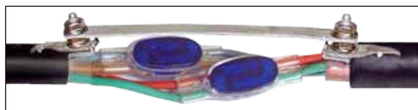
Рис. 3.3 Установка экранной шины

3.3.7 Наденьте на винты экранных соединителей алюминиевую шину, входящую в комплект и зафиксируйте ее винтами. Экранная шина и соединители Скотчлок придают всей конструкции дополнительную механическую прочность (рис. 3.3).