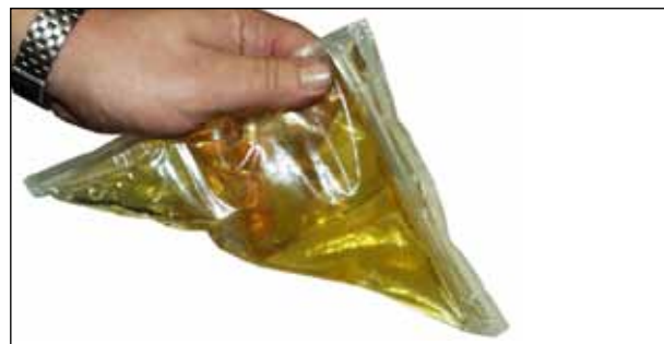
Рис. 3.6 Перемешивание компонентов компаунда (герметика) внутри пластмассового пакета

3.4.4. Достаньте из упаковки пакет с компаундом (герметиком), разорвите перемычку между составными частями компаунда (герметика) и тщательно перемешайте их внутри пакета (рис. 3.6). 3.6). Наденьте резиновые перчатки, отрежьте угол упаковки и аккуратно выдавите компаунд (герметик) в отверстие муфты МГП 0,1/0,3 до полного заполнения внутреннего объема муфты, не допуская перелива. Закройте отверстия пробками и зафиксируйте их лентой виниловой 88Т.