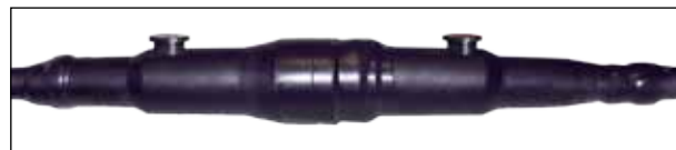
Рис. 3.5 Места намотки ленты виниловой 88Т

3.4.3. Поверх мастичной лентой 2900R обмотайте каждое место стыка двумя слоями ленты виниловой 88Т с натяжением и перекрытием витков 50%, заходя за края мастичной ленты на 30 мм с каждой стороны (рис. 3.5).